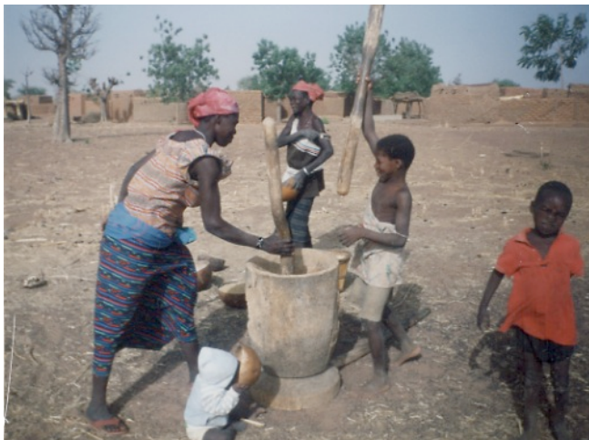
Femmes et enfants de Sambtenga